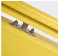
Schiene mit Konsole.