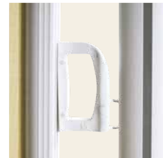
Befestigung am Pfosten.