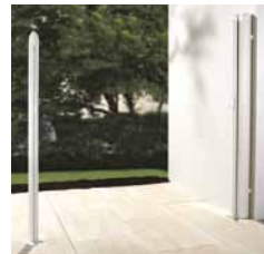
Pfosten zur Fixierung.